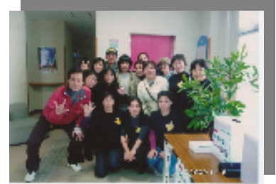
▲映画「ゆずり葉」上映時

福江手話サークルは昭和53年、潜水夫のろうあ者が病院で病状をうまく伝えることができなかつたことをきっかけに、相談を受けた身体障害者協会の役員を通じて市内の看護師などに集ってもらい、市の職員が独学で勉強し講師役になり、地元ろうあ者の協力を得ながら活動をスタートしました。翌年の4月からは市の補助のもと「手話講習会」を実施しており、現在ではお花見、講習会、クリスマス会や学校・幼稚園などでの手話教室、五島市福祉大会等の手話通訳など幅広く活動しています。また、アイアンマン大会では開催第1回目から、ろうあ者選手のサポートを行っており、約20名のサークル員が各所に待機し、連絡を取り合い、時にはリタイア寸前の選手を励ましなが、選手と一体となって大会を盛り上げています。離島というハンデもありますが、平成18年に長崎と五島のろうあ者で行った「五島さるく」をきっかけに、全国のろうあ者に五島の観光地を手話で説明できるよう、サークルとしても頑張っていきたいと思っています。