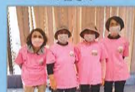
「コスモス会」の皆さん