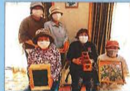
「ボランティアグループ 水仙」 の皆さん