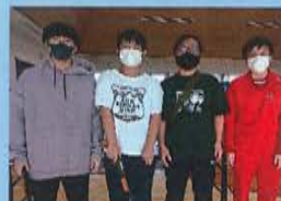
「長崎県立五島高等学校 定時制」 の皆さん