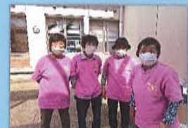
「二本楠ボランティア」 の皆さん