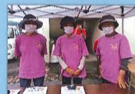
「寺脇ボランティア」 の皆さん