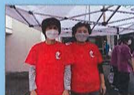
「川原ボランティア」 の皆さん